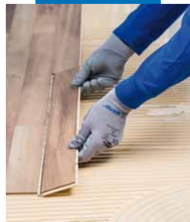
Verlegung des Parketts